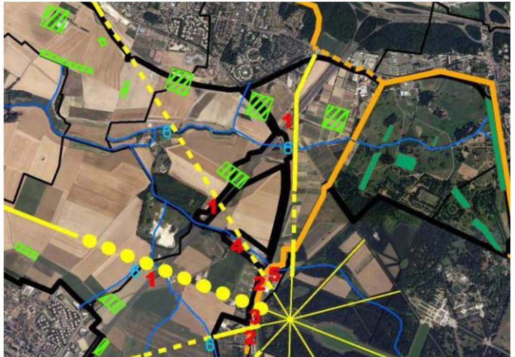
Ru de Maltoute en bleu ci-dessus, en vert ci-dessous

Reconnue d'utilité publique par décret du 13 mai 1998.