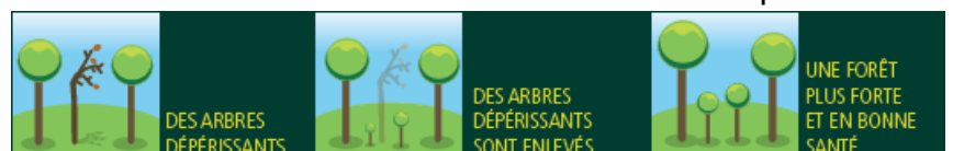
Illustration d'une coupe sanitaire

Contact ONF agence Ysatys Nadji ysatys.nadji@onf.fr